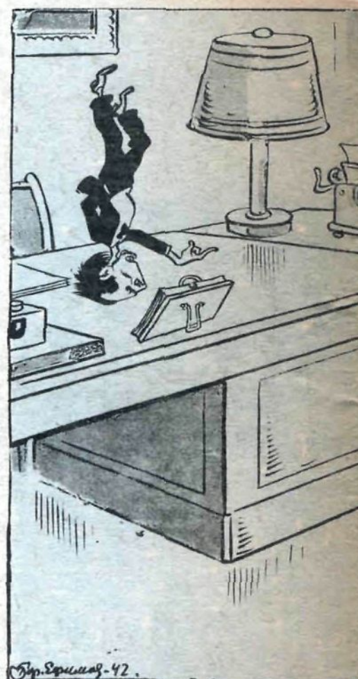
Рис. Бэр. Ефимова