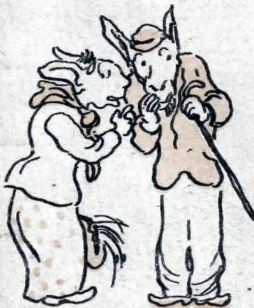
— Вот так новость!..