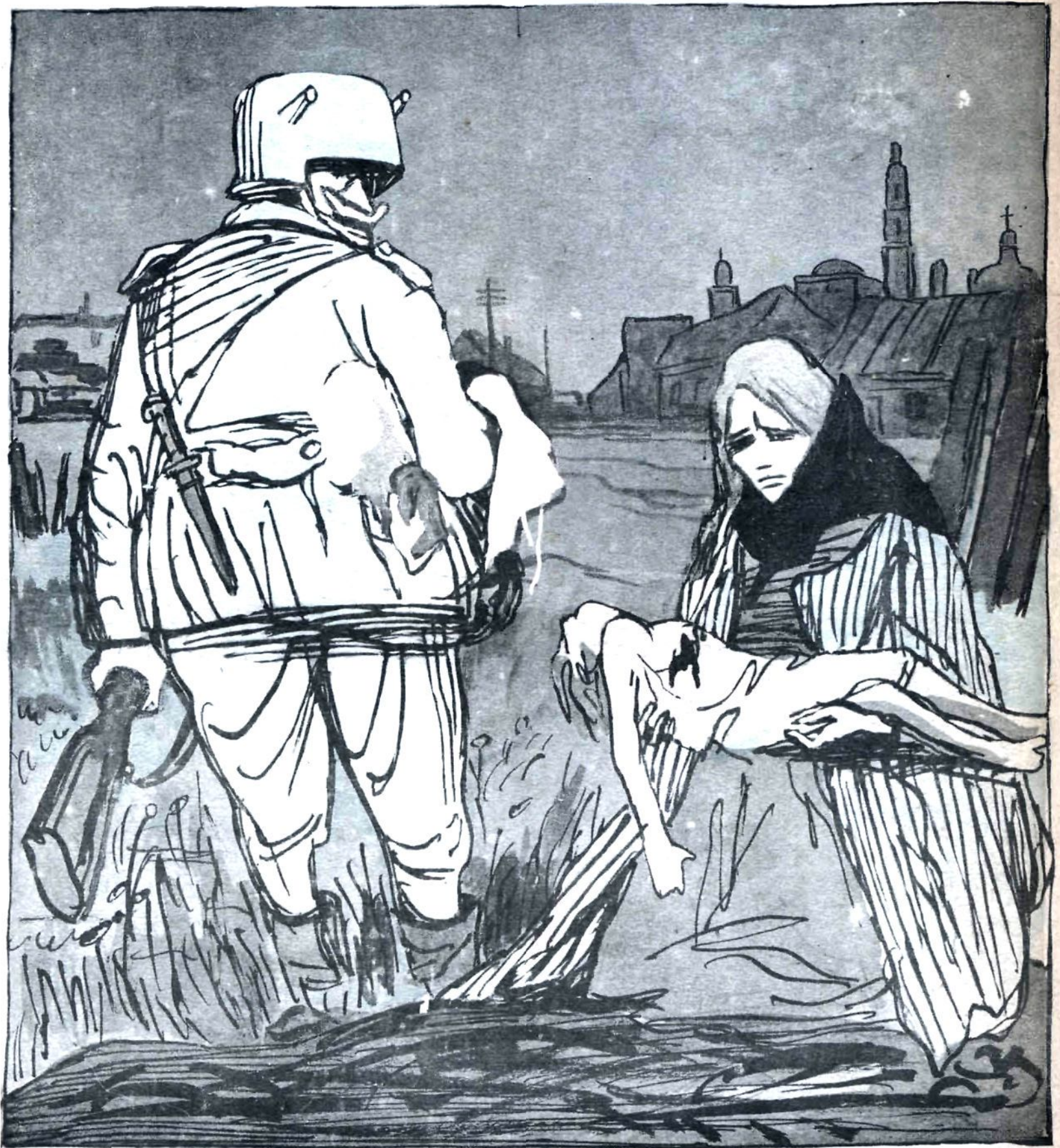
Рис. Л. Бродаты

— Кто скажет, что я плохо отношусь к детям! Вот одежонку с твоего мальчишки я и беру для моего Ганса.