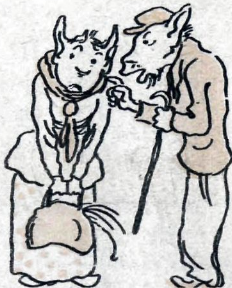
— Уверю вас!.. Это точно!..