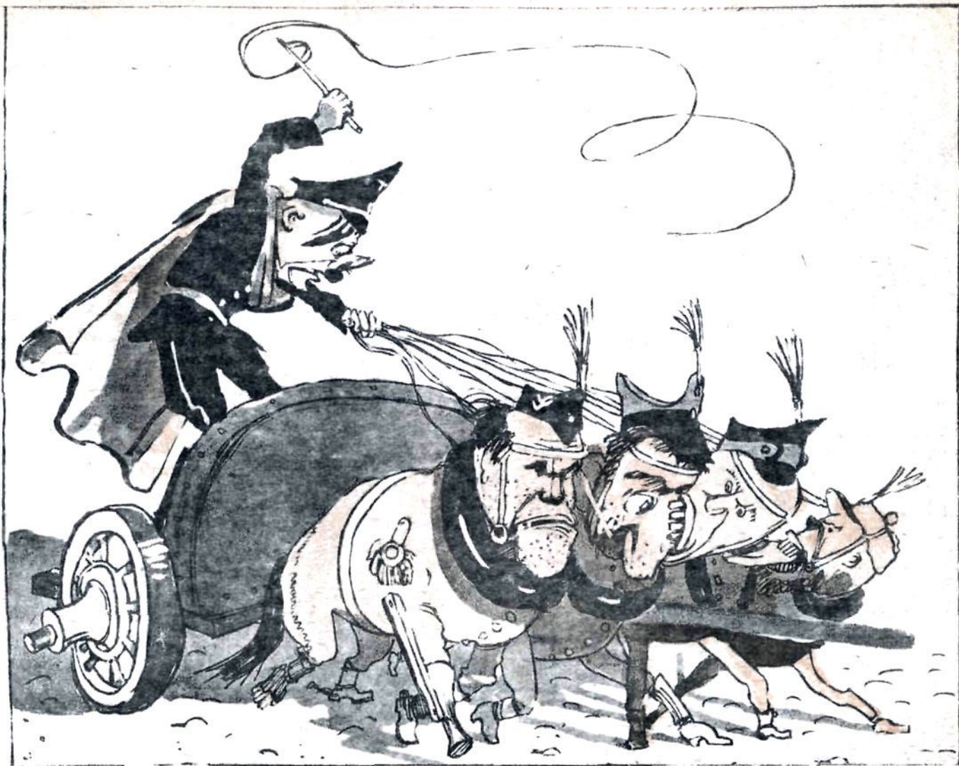
— Ямщик, не гони лошадей!..