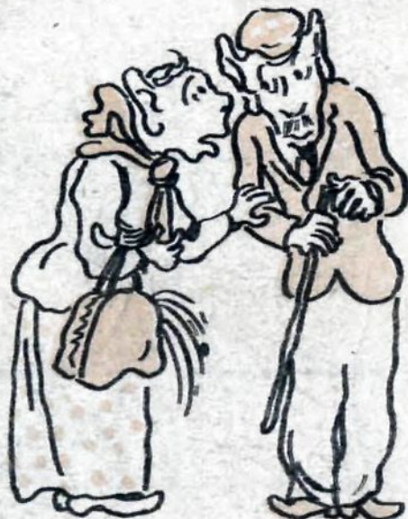
— Да что вы говорите?..