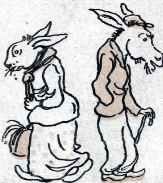
— Пойти рассказать...