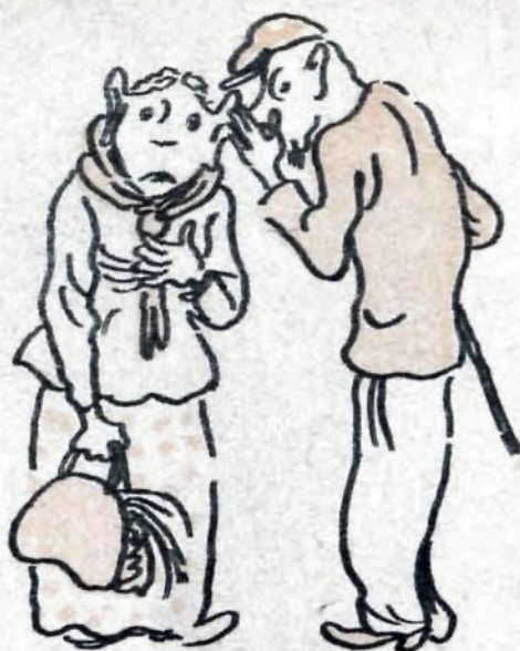
— Рассказал один солидный человек... Не трепач...